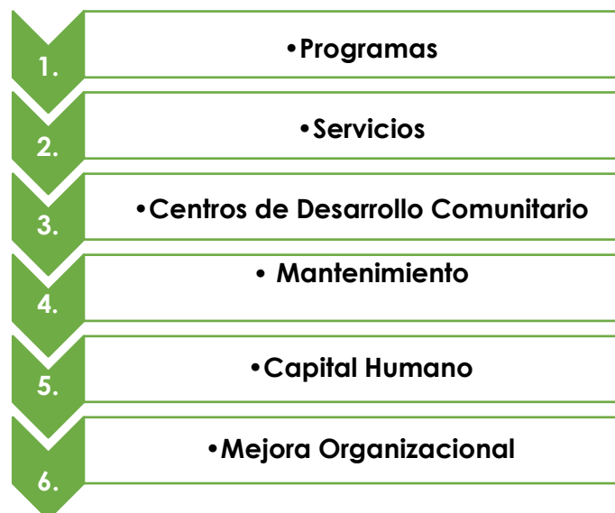
Diagrama 1. Agenda SMDIF de Soledad de Graciano Sánchez 2017-2018.

De esta manera, el trabajo que se realiza en el gran equipo de trabajo que conforma al DIF Municipal de Soledad de Graciano Sánchez. Para tener mayor claridad, se han estructurado bajo las siguientes seis categorías: 1) programas, 2) servicios, 3) centros de desarrollo comunitario, 4) infraestructura, equipamiento y mantenimiento 5) capital humano y 6) mejora organizacional.